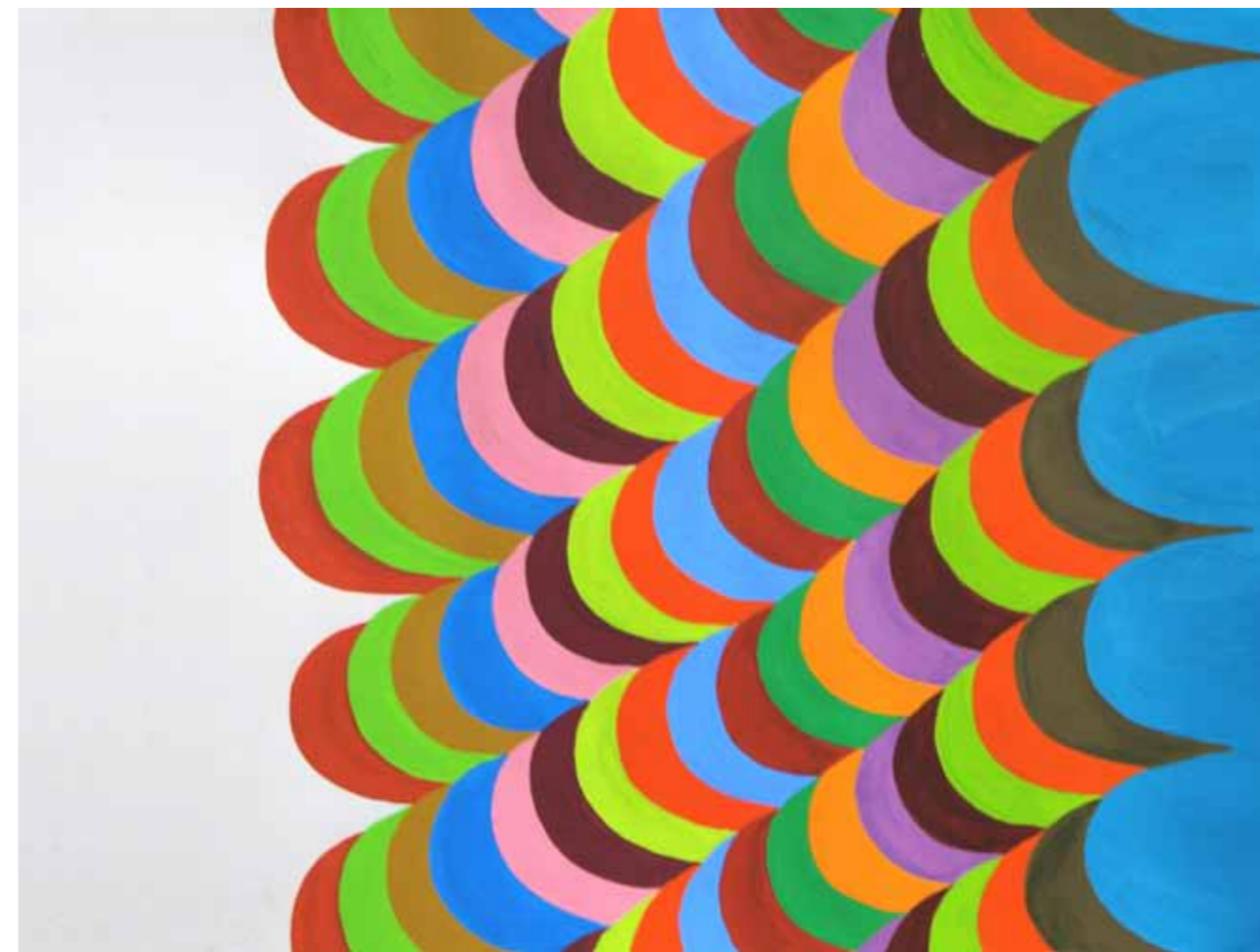
• Sans titre . 2008. Gouache sur papier. 30 × 42 cm